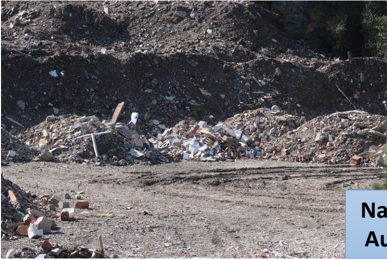
Nature des déchets visibles Aucun contrôle n'a été fait